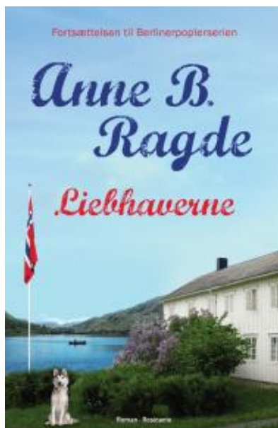
(/boeger/liebhaverne-0) LIEBHAVERNE (/BOEGER/LIEBHAVERNE-0) Af Anne B. Ragde