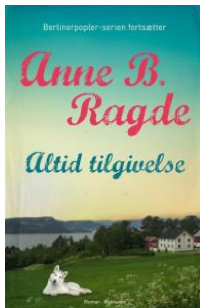
(/boeger/altid-tilgivelse) ALTID TILGIVELSE (/BOEGER/ALTID-TILGIVELSE) Af Anne B. Ragde