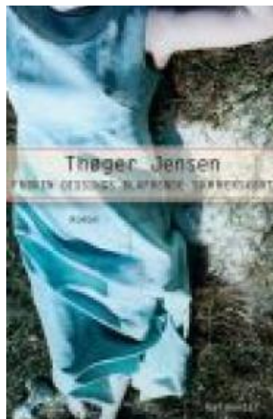
(/boeger/froken-dissings-blafrende-sommerskort) FRØKEN DISSINGS BLAFRENDE SOMMERSKORT (/BOEGER/FROKEN-DISSINGS-BLAFRENDE-SOMMERSKORT) Af Thøger Jensen