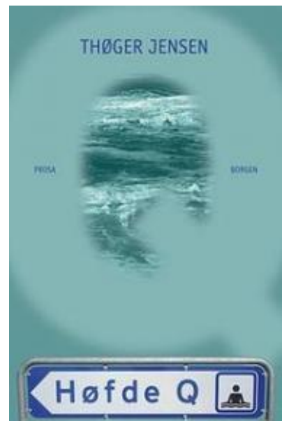
(/boeger/hofde-q) HØFDE Q (/BOEGER/HOFDE-Q) Af Thøger Jensen