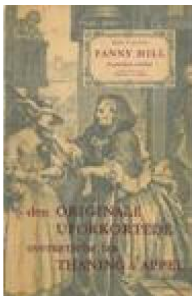
(/boeger/fanny-hill) FANNY HILL (/BOEGER/FANNY-HILL) Af John Cleland