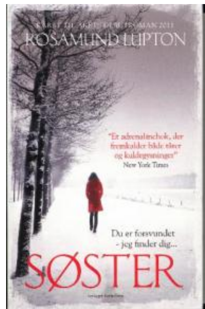
(/boeger/soster) SØSTER (/BOEGER/SOSTER) Af Rosamund Lupton