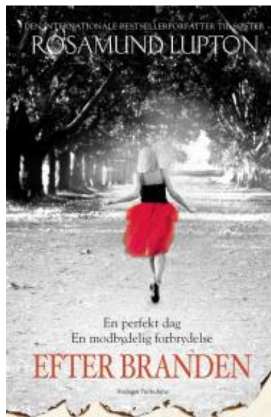
(/boeger/efter-branden) EFTER BRANDEN (/BOEGER/EFTER-BRANDEN) Af Rosamund Lupton