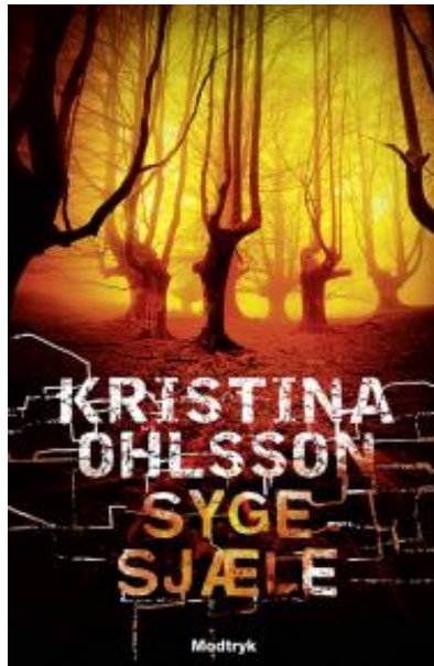
(/boeger/syge-sjæle) SYGE SJÆLE (/BOEGER/SYGE-SJAELE) Af Kristina Ohlsson