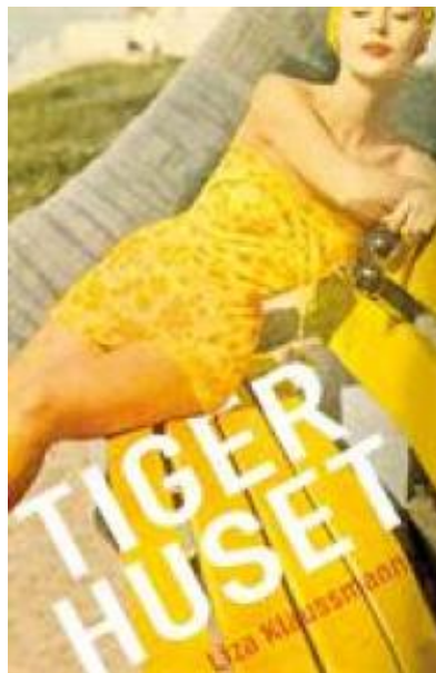
(/boeger/tigerhuset) TIGERHUSET (/BOEGER/TIGERHUSET) Af Liza Klausmann