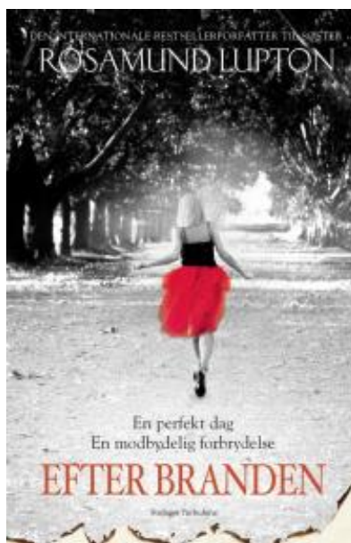
(/boeger/efter-branden) EFTER BRANDEN (/BOEGER/EFTER-BRANDEN) Af Rosamund Lupton