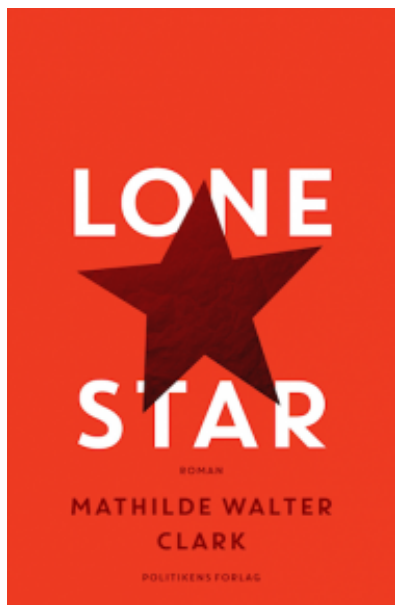
(/boeger/lone-star) LONE STAR (/BOEGER/LONE-STAR) Af Mathilde Walter Clark