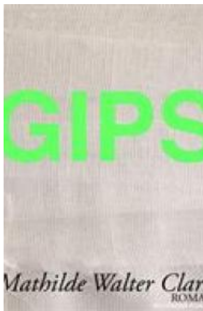
(/boeger/gips) GIPS (/BOEGER/GIPS) Af Mathilde Walter Clark