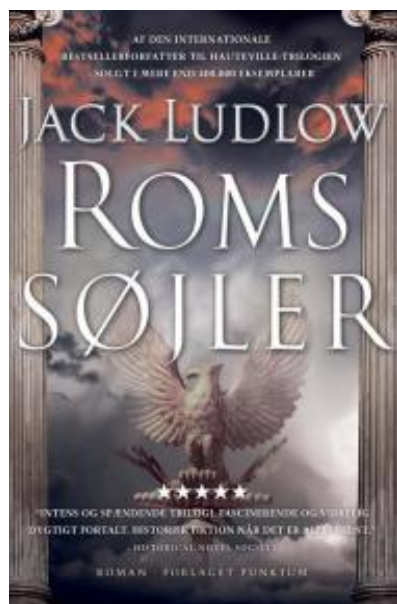
(/boeger/roms-sojler) ROMS SØJLER (/BOEGER/ROMS-SOJLER) Af Jack Ludlow