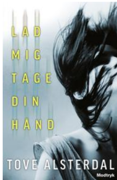
(/boeger/lad-mig-tage-din-hand) LAD MIG TAGE DIN HÅND (/BOEGER/LAD-MIG-TAGE-DIN-HAND) Af Tove Alsterdal