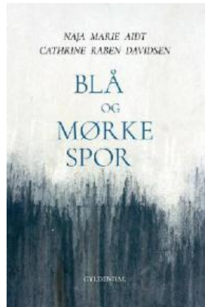
(/boeger/bla-og-mørke-spor-digte-og-billeder) BLÅ OG MØRKE SPOR : DIGTE OG BILLEDER (/BOEGER/BLA-OG-MØRKE-SPOR-DIGTE-OG-BILLEDER) Af Naja Marie Aidt