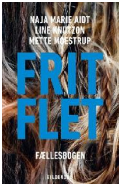
(/boeger/frit-flet-faellesbogen) FRIT FLET : FÆLLESBOGEN (/BOEGER/FRIT-FLET-FAELLESBOGEN) Af Naja Marie Aidt