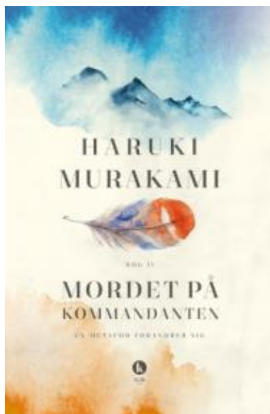
(/boeger/mordet-pa-kommandanten-bind-2) MORDET PÅ KOMMANDANTEN - BIND 2 (/BOEGER/MORDET-PA-KOMMANDANTEN-BIND-2) Af Haruki Murakami