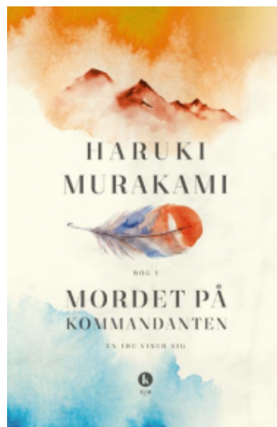
(/boeger/mordet-pa-kommandanten) MORDET PÅ KOMMANDANTEN (/BOEGER/MORDET-PA-KOMMANDANTEN) Af Haruki Murakami