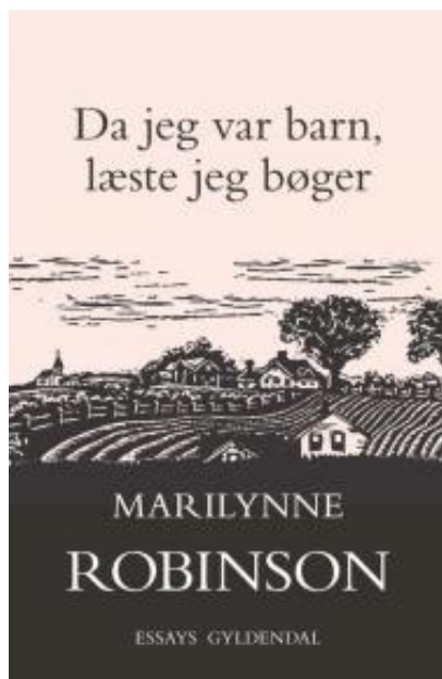
(/boeger/da-jeg-var-barn-laeste-jeg-boger) DA JEG VAR BARN, LÆSTE JEG BØGER (/BOEGER/DA-JEG-VAR-BARN-LÆSTE-JEG-BØGER) Af Marilynne Robinson