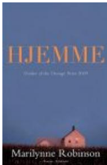
(/boeger/hjemme) HJEMME (/BOEGER/HJEMME) Af Marilynne Robinson