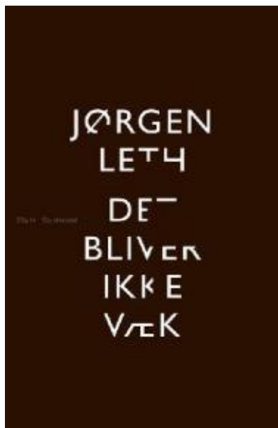
(/boeger/det-bliver-ikke-vaek-digte) DET BLIVER IKKE VÆK (/BOEGER/DET-BLIVER-IKKE- VAEK-DIGTE) Af Jørgen Leth