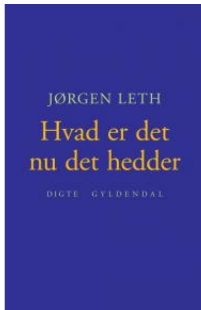
(/boeger/hvad-er-det-nu-det-hedder) HVAD ER DET NU DET HEDDER (/BOEGER/HVAD-ER- DET-NU-DET-HEDDER) Af Jørgen Leth