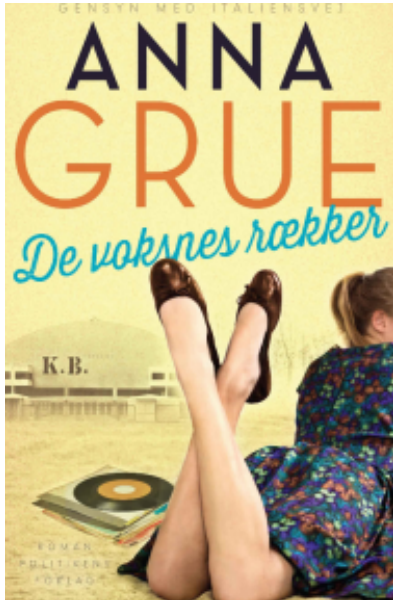
(/boeger/de-voksnes-raekker) DE VOKSNES RÆKKER (/BOEGER/DE-VOKSNES- RAEKKER) Af Anna Grue