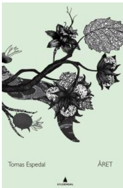
(/boeger/aret-0) ÅRET (/BOEGER/ARET-0) Af Tomas Espedal