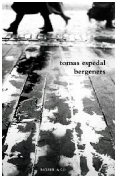
(/boeger/bergeners) BERGENERS (/BOEGER/BERGENERS) Af Tomas Espedal