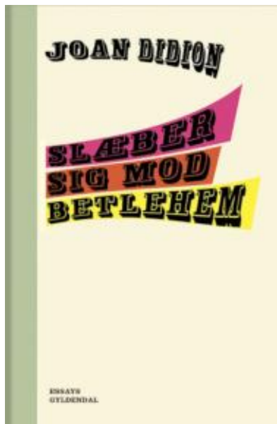
(/boeger/slaeber-sig-mod-betlehem) SLÆBER SIG MOD BETLEHEM (/BOEGER/SLAEER-SIG-MOD-BETLEHEM) Af Joan Didion