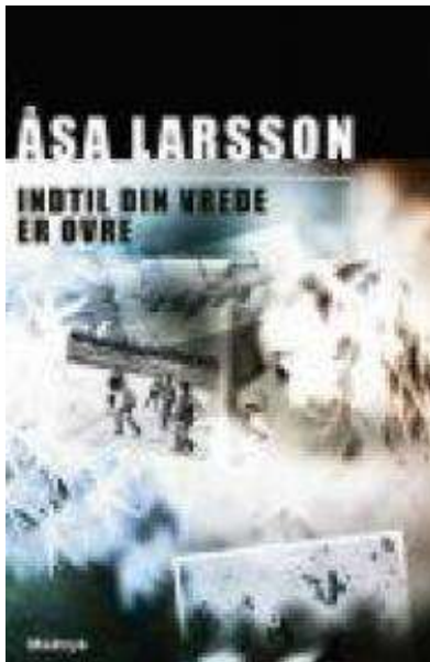
(/boeger/indtil-din-vrede-er-ovre) INDTIL DIN VREDE ER OVRE (/BOEGER/INDTIL-DIN-VREDE-ER-OVRE) Af Åsa Larsson