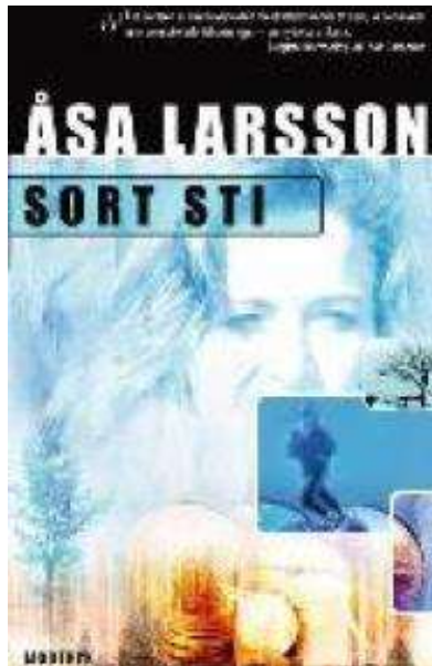
(/boeger/sort-sti) SORT STI (/BOEGER/SORT-STI) Af Åsa Larsson