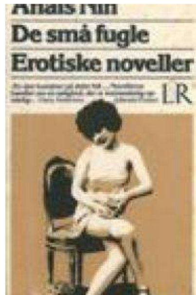
(/boeger/de-sma-fugle) DE SMÅ FUGLE (/BOEGER/DE-SMA-FUGLE) Af Anais Nin