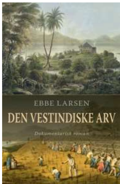
(/boeger/den-vestindiske-arv) DEN VESTINDISKE ARV (/BOEGER/DEN-VESTINDISKE-ARV) Af Ebbe Larsen