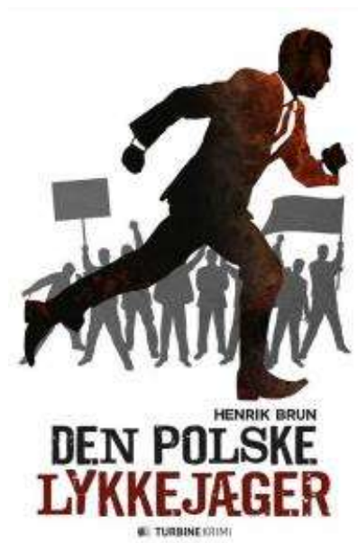
(/boeger/den-polske-lykkejaeger) DEN POLSKE LYKKEJÆGER (/BOEGER/DEN-POLSKE- LYKKEJAEGER) Af Henrik Brun