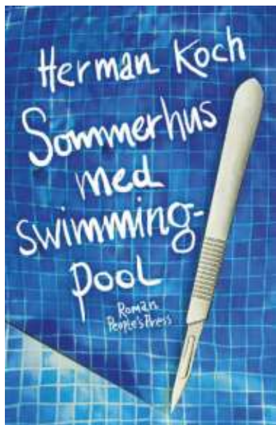
(/boeger/sommerhus-med-swimmingpool) SOMMERHUS MED SWIMMINGPOOL (/BOEGER/SOMMERHUS-MED-SWIMMINGPOOL) Af Herman Koch