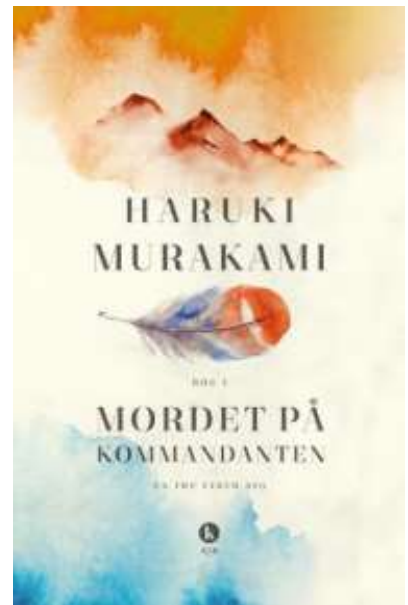
(/boeger/mordet-pa-kommandanten) MORDET PÅ KOMMANDANTEN (/BOEGER/MORDET-PA-KOMMANDANTEN) Af Haruki Murakami