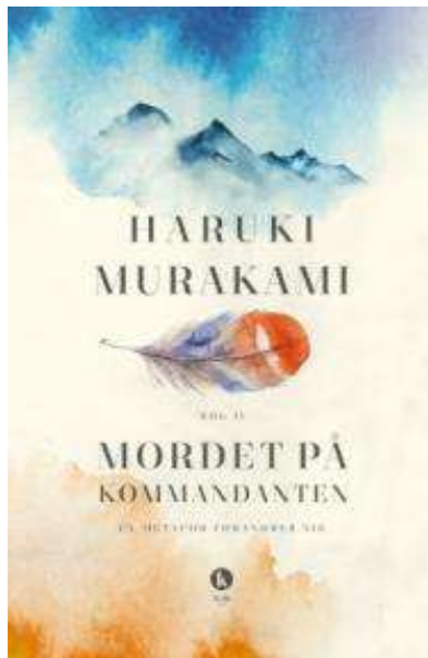
(/boeger/mordet-pa-kommandanten-bind-2) MORDET PÅ KOMMANDANTEN - BIND 2 (/BOEGER/MORDET-PA-KOMMANDANTEN-BIND-2) Af Haruki Murakami