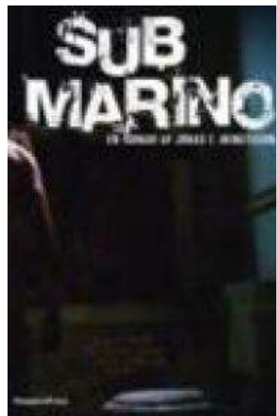
(/boeger/submarino) SUBMARINO (/BOEGER/SUBMARINO) Af Jonas T. Bengtsson