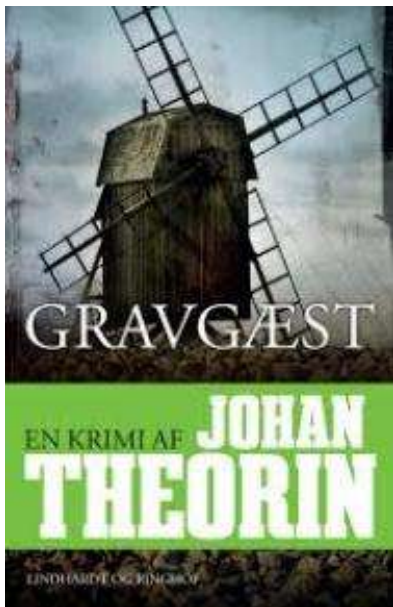
(/boeger/gravgaest) GRAVGÆST (/BOEGER/GRAVGAEST) Af Johan Theorin