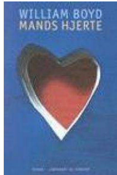
(/boeger/mands-hjerte) MANDS HJERTE (/BOEGER/MANDS-HJERTE) Af William Boyd