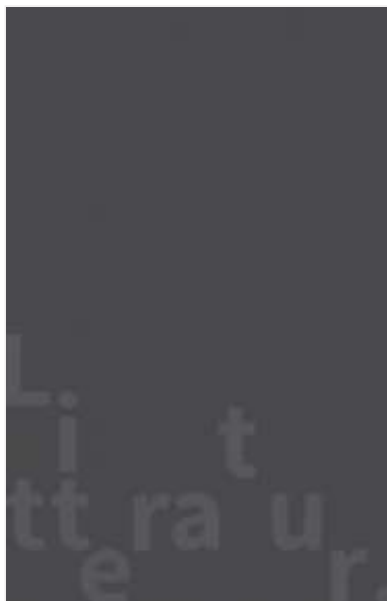
(/boeger/restless) RESTLESS (/BOEGER/RESTLESS) Af William Boyd