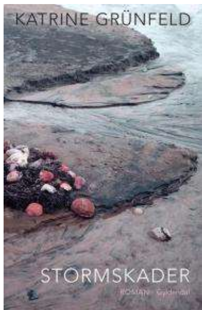
(/boeger/stormskader) STORMSKADER (/BOEGER/STORMSKADER) Af Katrine Grünfeld