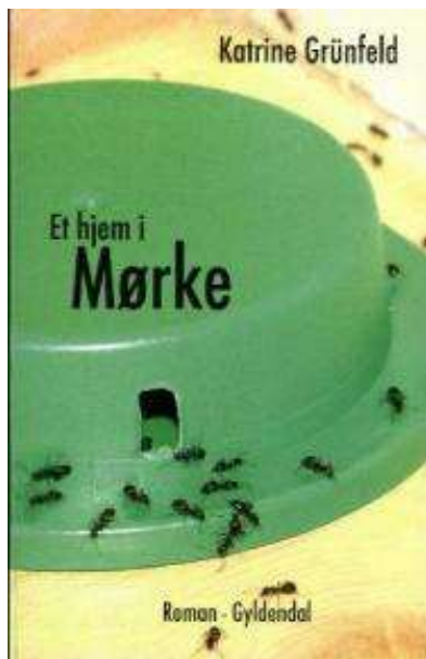
(/boeger/et-hjem-i-mørke) ET HJEM I MØRKE (/BOEGER/ET-HJEM-I-MØRKE) Af Katrine Grünfeld