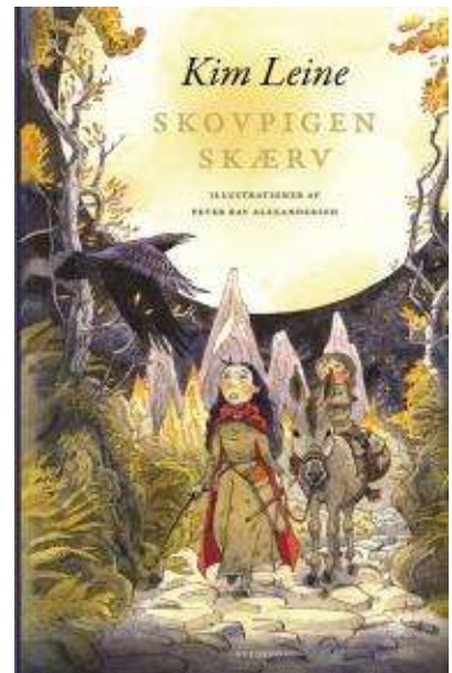
(/boeger/skovpigen-skaerv) SKOVPIGEN SKÆRV (/BOEGER/SKOVPIGEN-SKAERV) Af Kim Leine