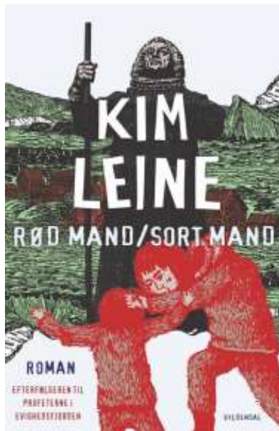
(/boeger/rod-mandsort-mand) RØD MAND/SORT MAND (/BOEGER/ROD-MANDSORT- MAND) Af Kim Leine