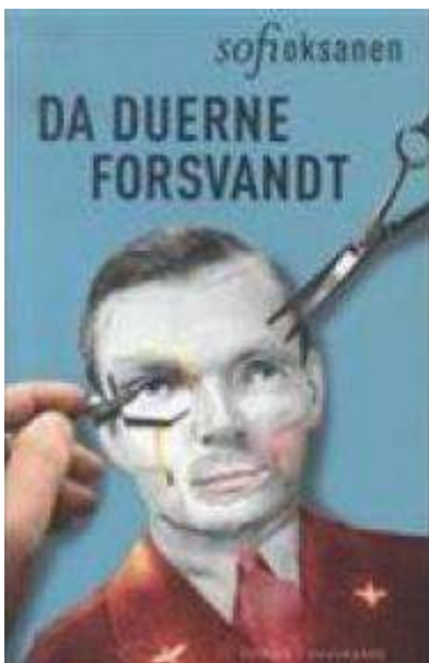
(/boeger/da-duerne-forsvandt) DA DUERNE FORSVANDT (/BOEGER/DA-DUERNE- FORSVANDT) Af Sofi Oksanen