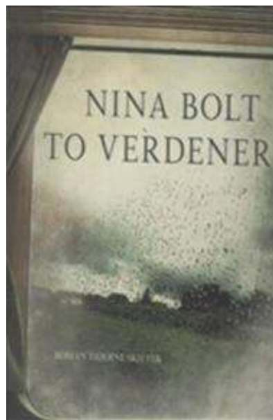
(/boeger/verdener-0) TO VERDENER (/BOEGER/VERDENER-0) Af Nina Bolt