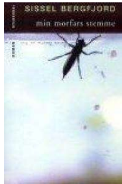
(/boeger/min-morfars-stemme) MIN MORFARS STEMME (/BOEGER/MIN-MORFARS-STEMME) Af Sissel Bergfjord