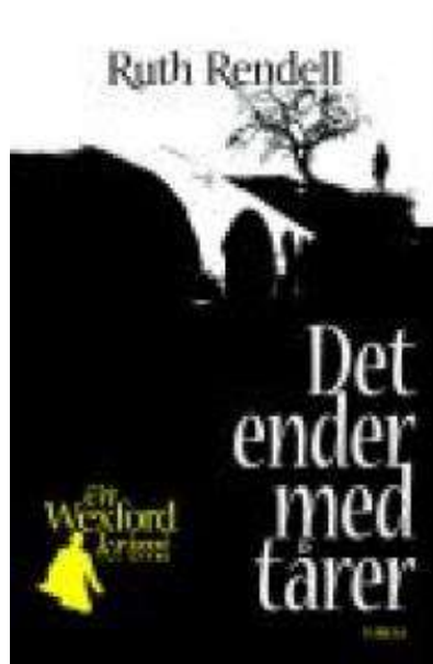
(/boeger/det-ender-med-tarer) DET ENDER MED TÅRER (/BOEGER/DET-ENDER-MED-TARER) Af Ruth Rendell