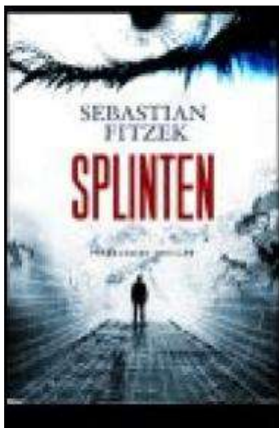
(/boeger/splinten) SPLINTEN (/BOEGER/SPLINTEN) Af Sebastian Fitzek