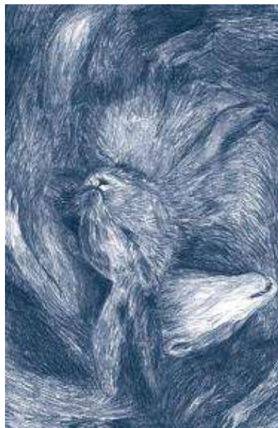
(/boeger/9-piger-hesten) 9 PIGER - HESTEN (/BOEGER/9-PIGER-HESTEN) Af Rikke Villadsen og Bjørn Rasmussen