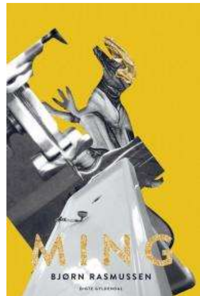
(/boeger/ming) MING (/BOEGER/MING) Af Bjørn Rasmussen