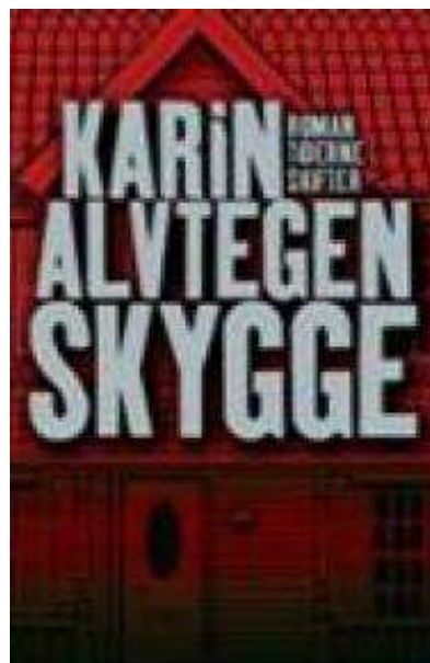
(/boeger/skygge) SKYGGE (/BOEGER/SKYGGE) Af Karin Alvtegen