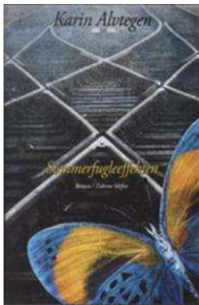
(/boeger/sommerfugleeffekten-0) SOMMERFUGLEEFFEKTEN (/BOEGER/SOMMERFUGLEEFFEKTEN-0) Af Karin Alvtegen