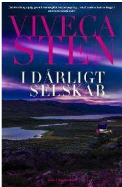
(/boeger/i-darligt-selskab) I DÅRLIGT SELSKAB (/BOEGER/I-DARLIGT-SELSKAB) Af Viveca Sten