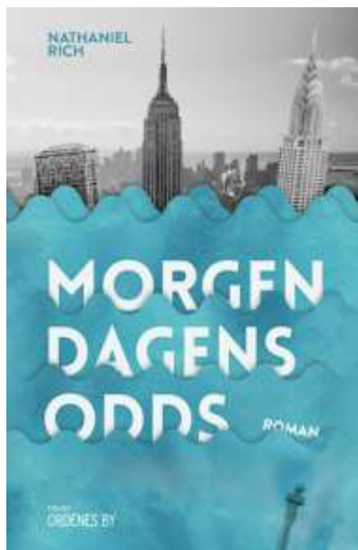
(/boeger/morgendagens-odds) MORGENDAGENS ODDS (/BOEGER/MORGENDAGENS- ODDS) Af Nathaniel Rich