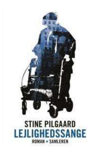
(/boeger/lejlighedssange) LEJLIGHEDSSANGE (/BOEGER/LEJLIGHEDSSANGE) Af Stine Pilgaard