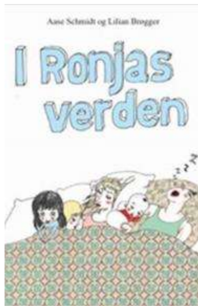
(/boeger/i-ronjas-verden) I RONJAS VERDEN (/BOEGER/I-RONJAS-VERDEN) Af Aase Schmidt