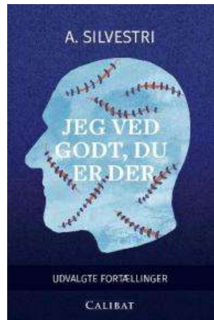
(/boeger/jeg-ved-godt-du-er-der-udvalgte-fortaelinger) JEG VED GODT, DU ER DER : UDVALGTE FORTÆLLINGER (/BOEGER/JEG-VED-GODT-DU-ER-DER-UDVALGTE-FORTAELLINGER) Af A. Silvestri