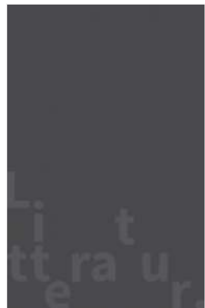
(/boeger/sommerstykke) SOMMERSTYKKE (/BOEGER/SOMMERSTYKKE) Af Christa Wolf