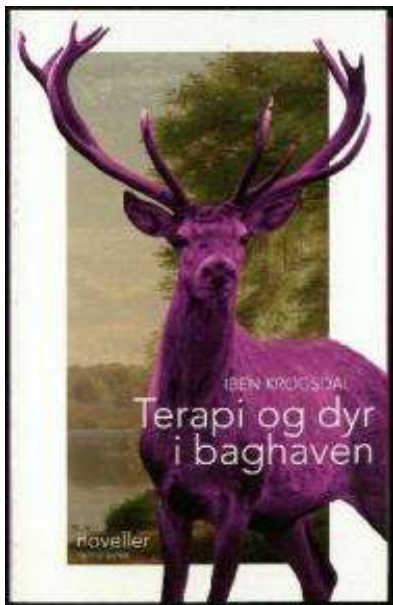
(/boeger/terapi-og-dyr-i-baghaven) TERAPI OG DYR I BAGHAVEN (/BOEGER/TERAPI-OG-DYR-I-BAGHAVEN) Af Iben Krogdald