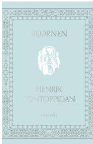
(/boeger/isbjornen) ISBJØRNEN (/BOEGER/ISBJORNEN) Af Henrik Pontoppidan