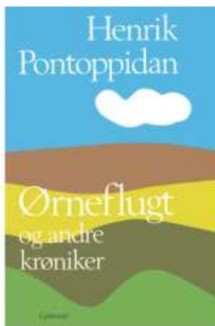
(/boeger/orneflugt-og-andre-kroniker) ØRNEFLUGT OG ANDRE KRØNIKER (/BOEGER/ORNEFLUGT-OG-ANDRE-KRONIKER) Af Henrik Pontoppidan