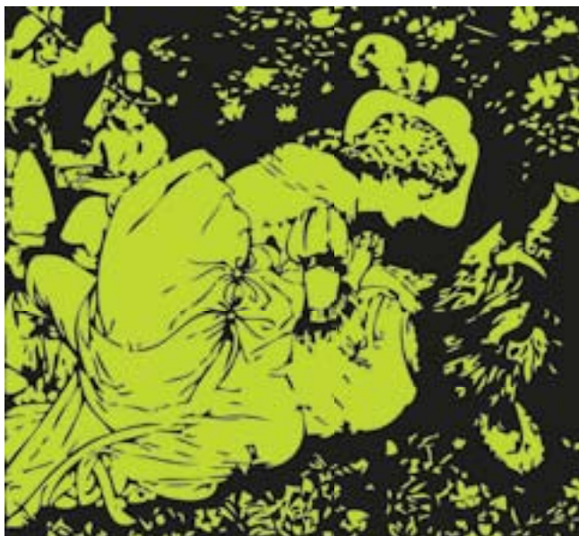
Udsnit af illustration af Walter Crane fra 'Beauty and the Beast' (London, 1874).

En moderne kvinde. Eventyrets forfatter var det, man i dag kalder en moderne kvinde. Og hun fortjener noget