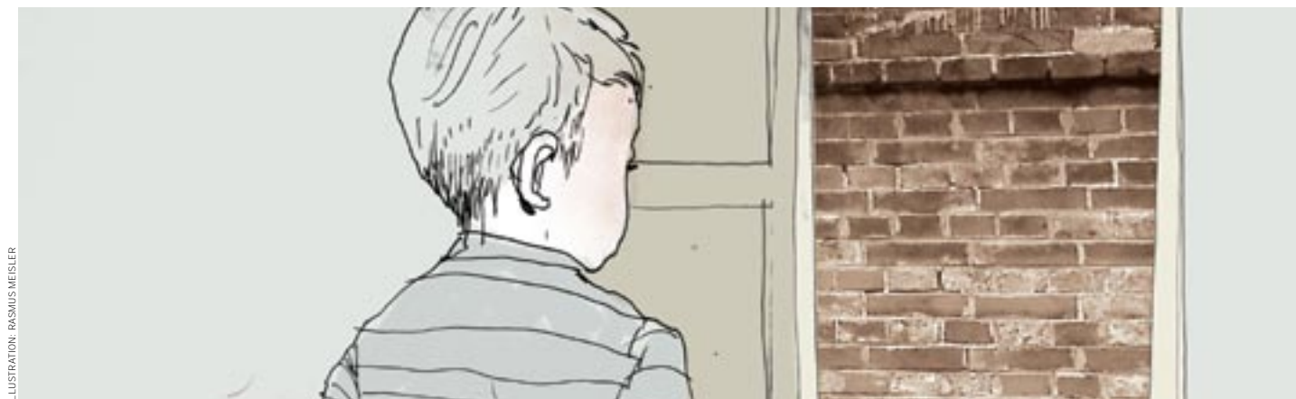
ILLUSTRATION: RASMUS MEISLER