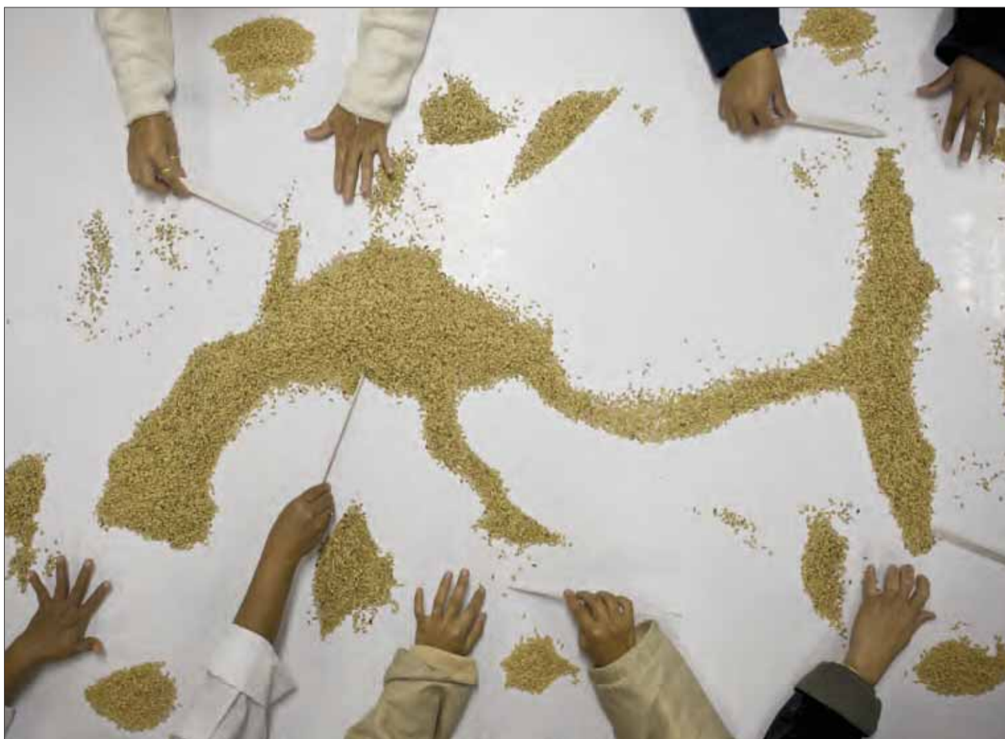
Ny fotoserie om fødevarekrisen, hvor også prisen på ris eksploderede.

Find hele John Stanmeyers fremragende serie på www.viipphoto.com/feature.html .