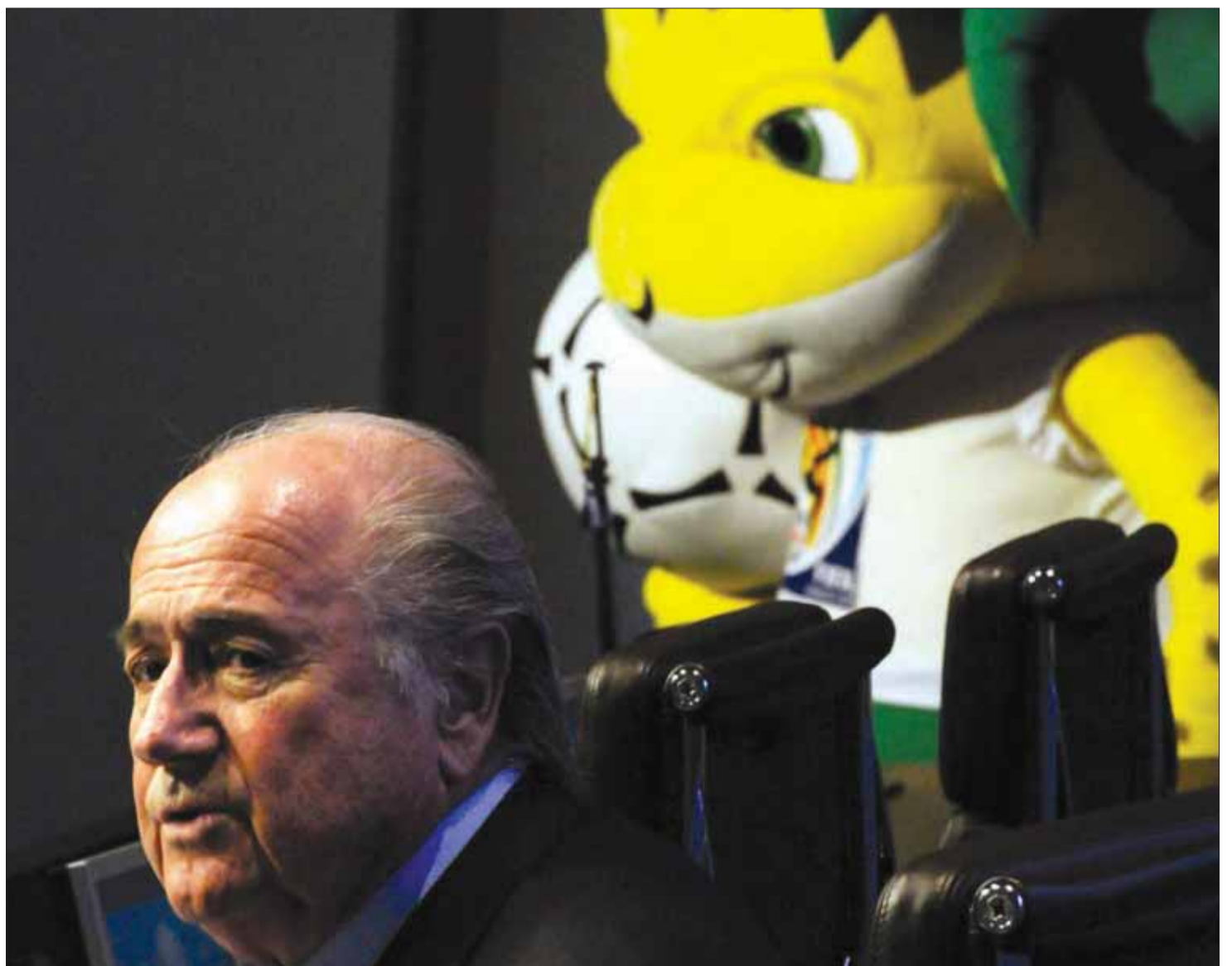
Fodboldforbundet FIFA's præsident Joseph Blatter foran VM's maskot, den sydafrikanske leopard Zakumi. Iagttagere hævder, at VM i Sydafrika gavner FIFA mere end lokalbefolkningen.