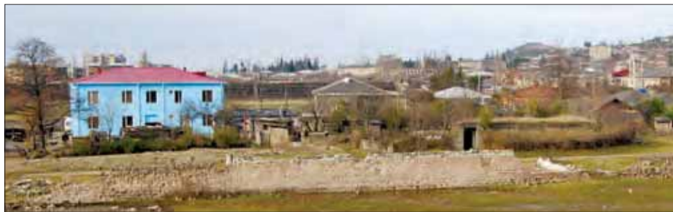
Efter endt renovering står et af de gamle flygtningekollektiver klar, og beboerne kan tage hul på et nyt kapitel.