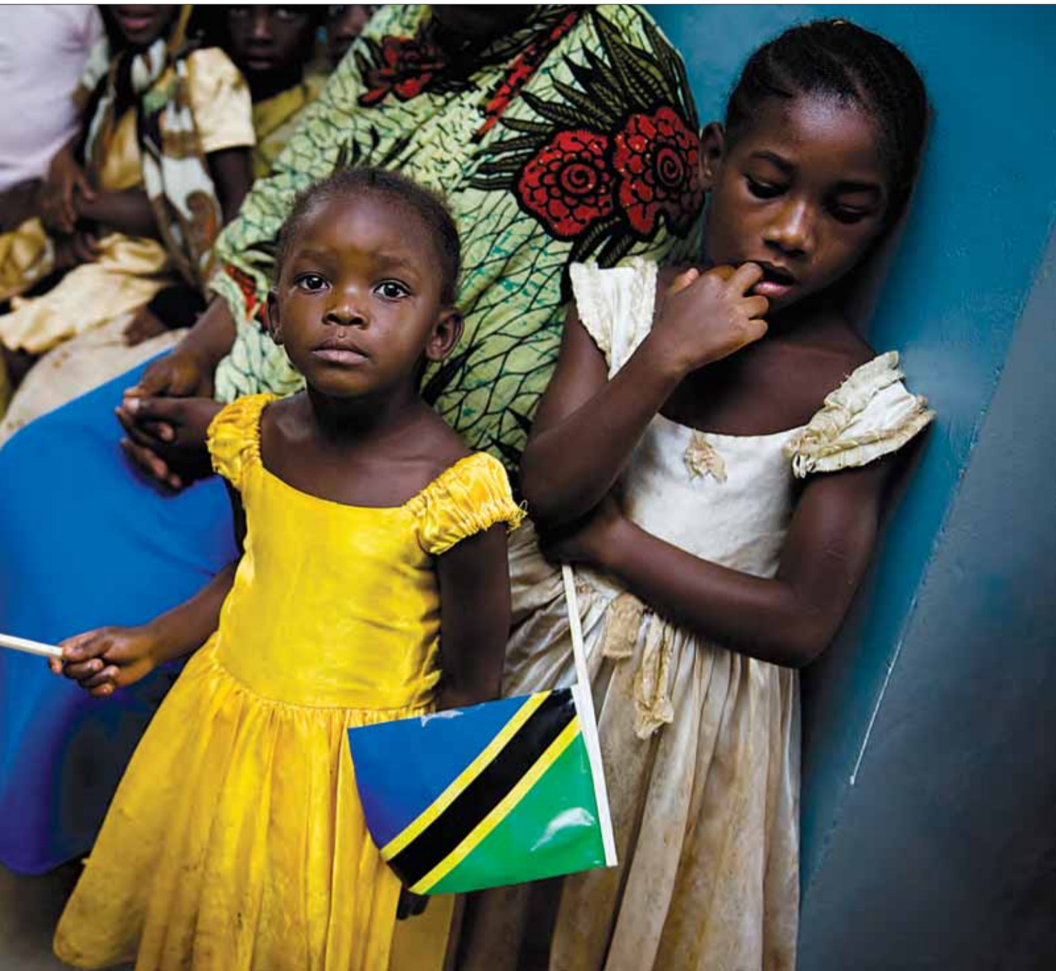
Udviklingsminister Søren Pind besøgte Tanzania i maj måned. Billedet her er fra statsbesøget til landet i 2008, hvor Regentparret blandt andet besøgte Kisimbani Sundhedscenter på øen Zanzibar.

dan de selv skal være effektive. Min pointe er, at donorerne burde være mere kritiske og mere ærlige om, hvad der sker.