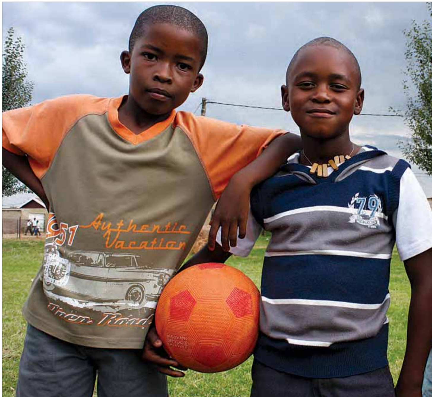
Disse fodboldglade drenge fra Tumahole er stolte over, at Sydafrika er vært for VM.