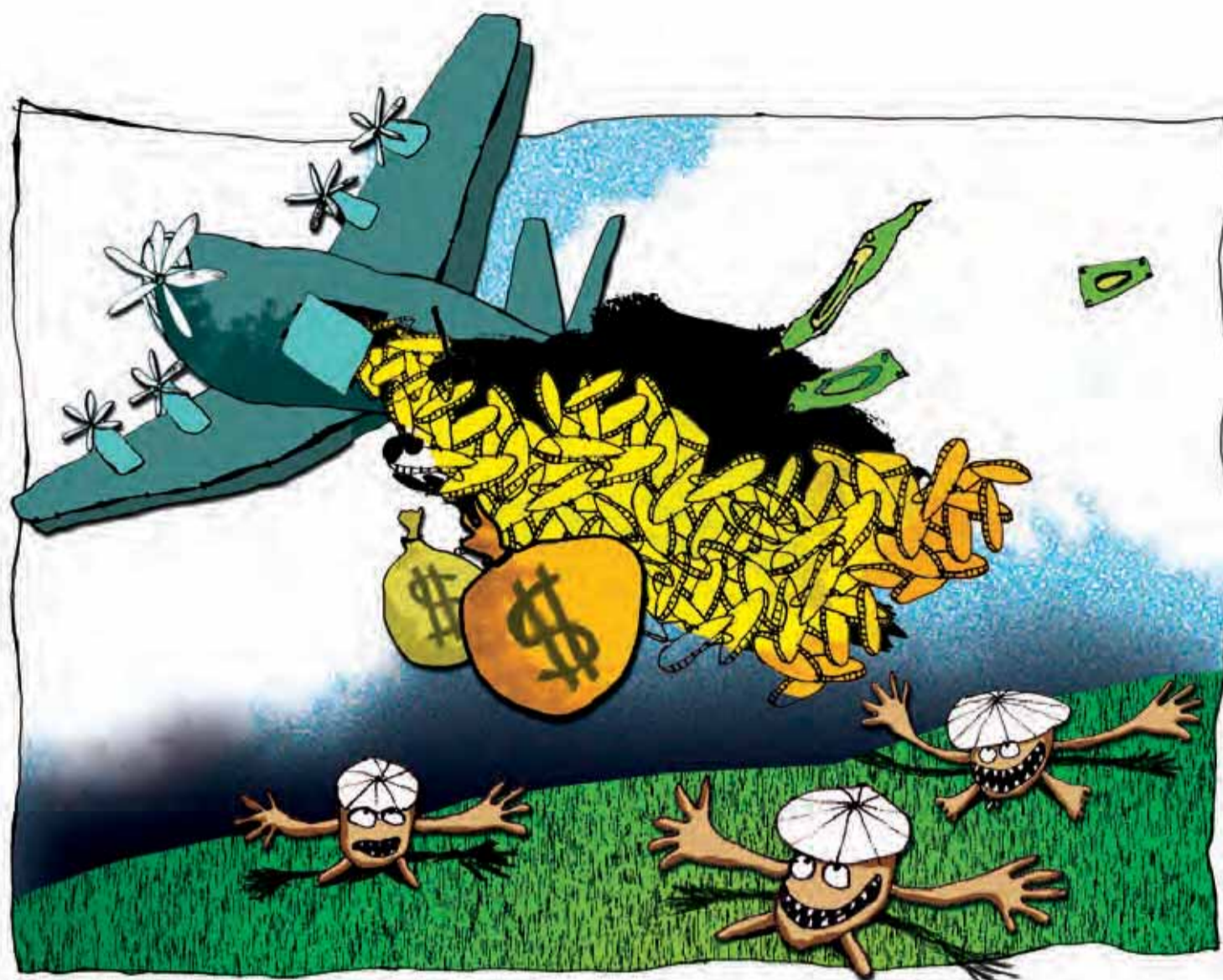
Oxfam har delt penge ud i Vietnam – stort set uden at stille krav til, hvordan de bliver brugt. Ill.: Louise Thrane Jensen for Udvikling.