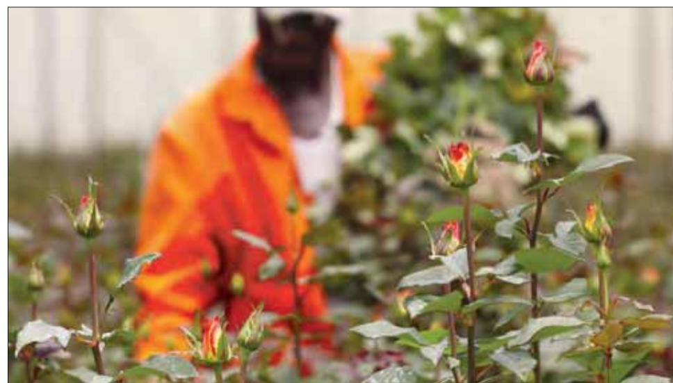
En medarbejder plukker blomster i et drivhus i Naivasha i Kenya – men islandske asker forhindrede i april fragt til Europa.

– Lige nu må vi smide alt ud, fordi vi er fuldstændig afhængige af luftfragt ud af Zam-