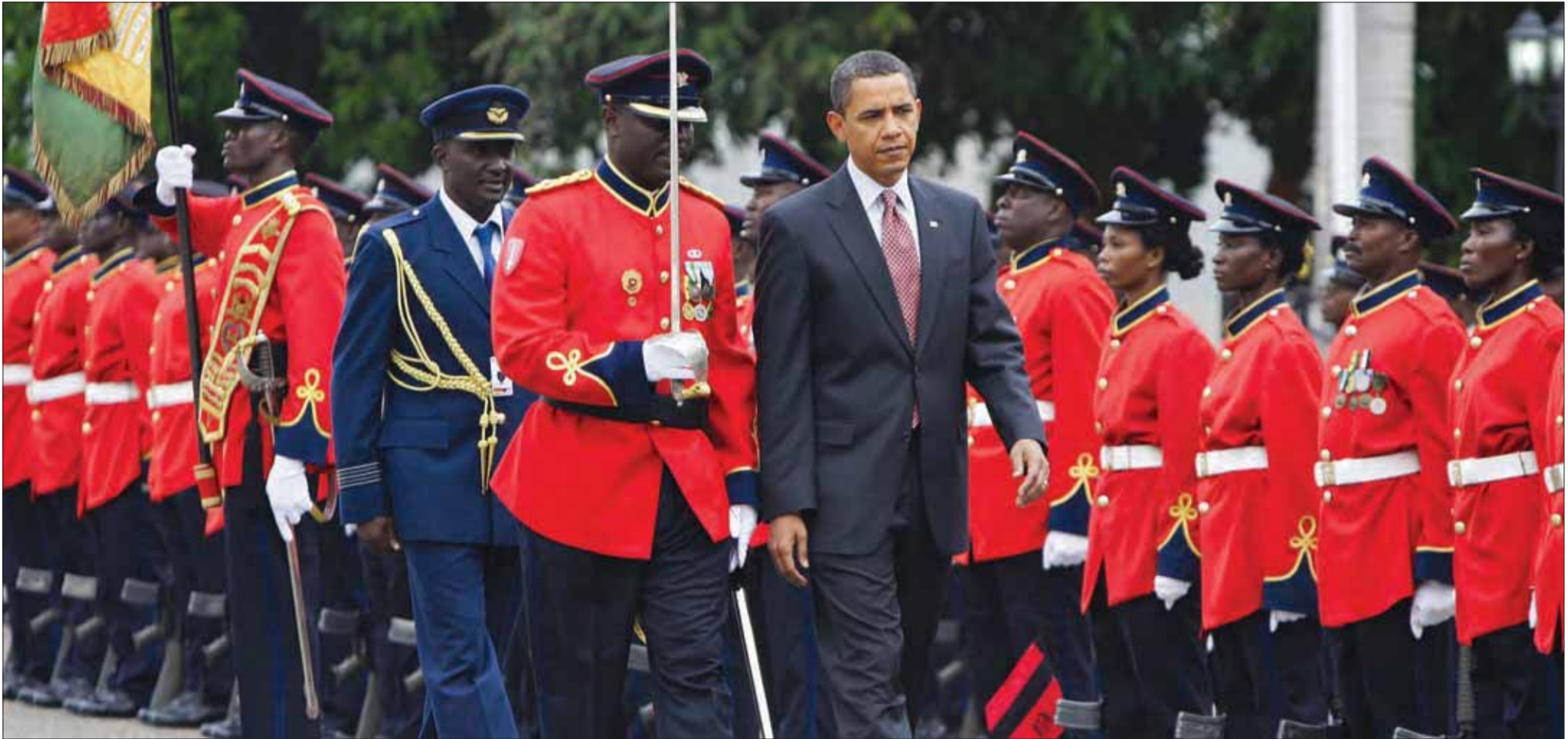
Barack Obama inspicerer ghanesisk velkomstparade i juli 2009. USA's interesse for Afrika er stigende – også militært.