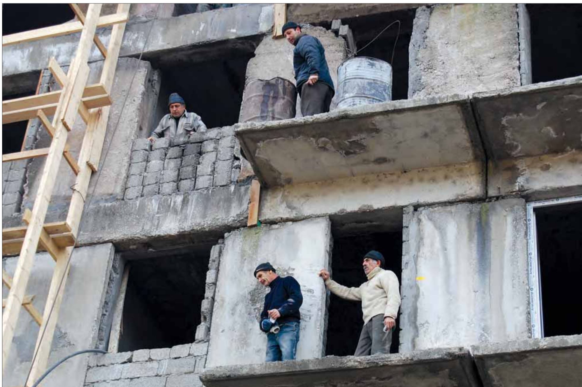
Internt fordrevne georgiere får skøder på de huse, de bor i. Her er de i gang med at renovere et hus i byen Senaki.

For nylig begyndte Georgiens regering at bløde op i spørgsmålet om flygtningenes status og forhold. Den taler nu åbent om, at flygtningene vil være fordrevne længe endnu, og at deres forhold skal gøres tålelige, dér hvor de bor.