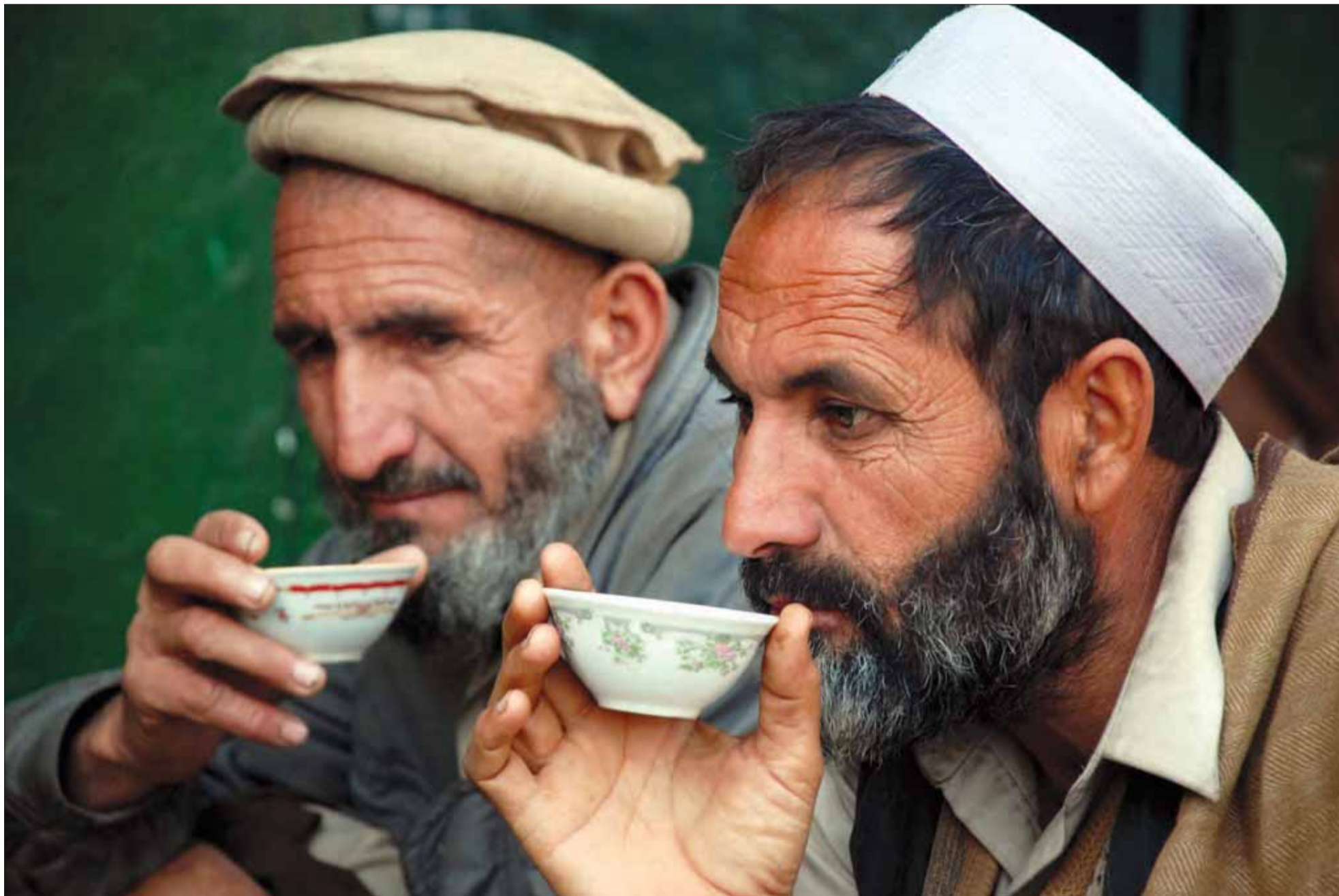
Stammeområderne – et hot issue. To mænd nyder en kop sort te i et tehús i Peshawar, Pakistan.

pakistanske hær hidtil ikke har udvist interesse i at fortrænge. Disse grupper har nære bånd til det pakistanske militære etablissement, der tidligere har brugt dem til at føre stedfortræderkrig mod Indien i Afghanistan.