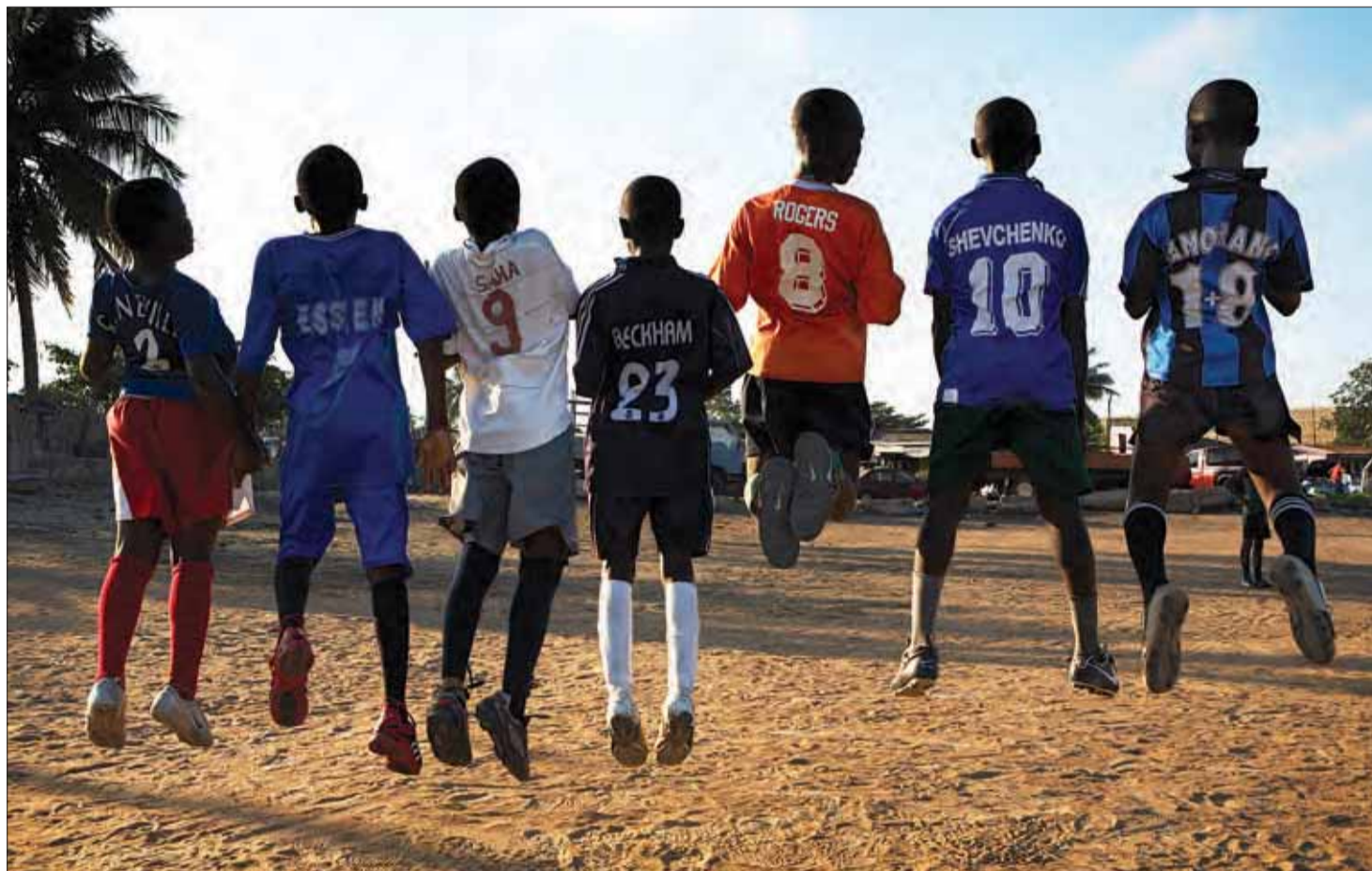
3,2,1... Hop! Drenge træner i Accra, Ghana.

afrika, som begynder 11. juni. Det bliver første gang, at slutrunden spilles på afrikansk jord.