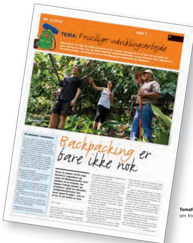
Temaforside af 2/2010 om frivillige, der rejser ud.

Når de unge kommer hjem, erklærer 85 procent, at de oplever deres indsats er blevet værdsat lokalt og 86 procent siger, de har forandret deres syn på, hvordan de selv kan bidrage til at gøre en forskel.