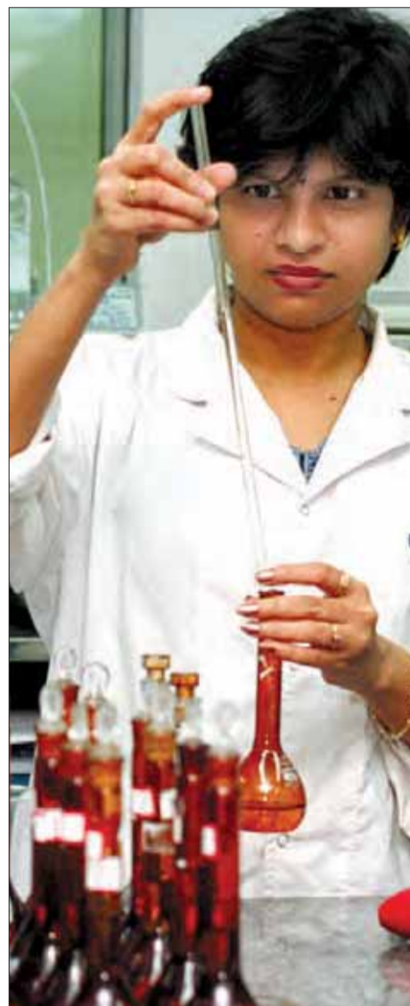
En farmaceut arbejder på et laboratorium i Bombay-afdelingen af den indiske lægemiddelfabrikant Cipla Ltd., som producerer såkaldt kopimedicin. EU og Indien forhandler om en aftale, som kan øge prisen på kopimedicin.

– Det er grotesk, at EU arbejder på den måde. Den ene side forsøger at sætte en stopper for billig medicin, mens den anden beta-