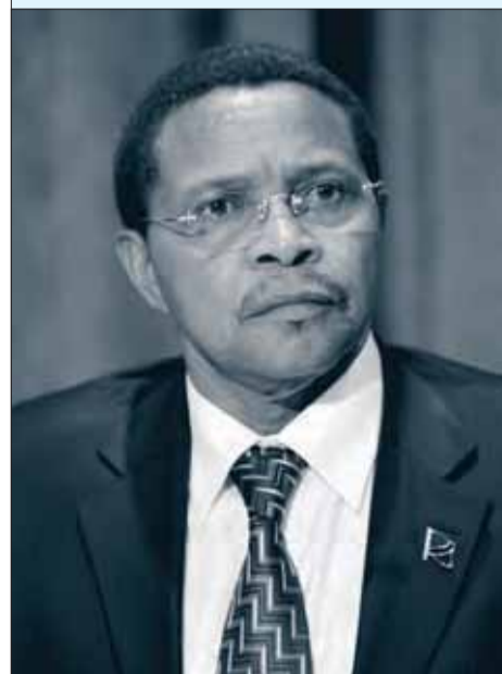
Tanzanias præsident Jakaya Kikwete blev valgt i 2005.

Kilde: Research and Education for Democracy (REPOA).