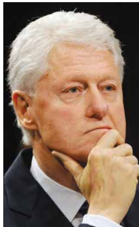
De to yderfronter i det geopolitiske spil om Haiti udgøres af USA med tidligere præsident Bill Clinton (tv.) i spidsen og de latinamerikanske ALBA-lande, anført af Venezuelas præsident Hugo Chavez.

USA har for sin del en kontroversiel fortid i Haiti. USA holdt Haiti besat 1915-34 og har gjort en aktiv figur i Haitis statskup. USA har også ført en aggressiv handelspolitik under præsident Bill Clinton (1993-2001, red.), som