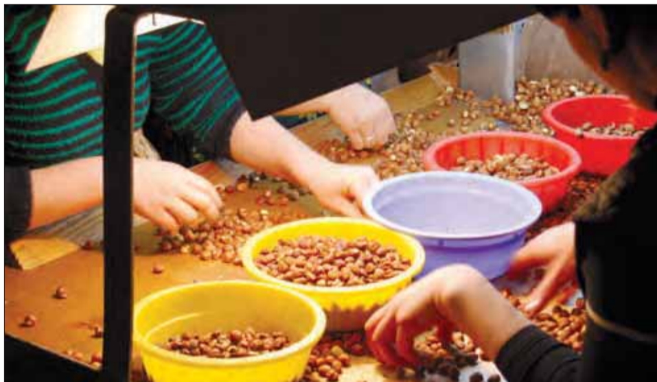
Hurtige hænder. Kvinder sorterer hasselnødder efter kvalitet i fabriksal i Zugdidi i det vestlige Georgien. Virksomheden er støttet af EU og har givet job til 87 personer – både lokale og flygtninge.

pladser, hjælpe spirende virksomheder og støtte oplæring af ufaglært arbejdskraft, siger Martin Klaucke.