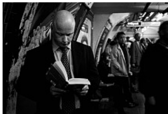
Bøger kan virke helbredende på patienter med psykiske lidelser og Alzheimers. Biblioterapi er et nyt begreb i England og ordineres af praktiserende læger.