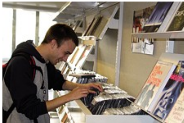
På Randers bibliotek skal »Hjørnet« tiltrække de unge.

Idéen med »Hjørnet« er, at de unge skal kunne smutte ind fra gaden og låne en film eller bog. Og for at kunne vise et stort udvalg af de nye spændende film, computerspil, musik og bøger, er det besluttet, at ingen materialer i »Hjørnet« kan reserveres. Samtidig er der på udvalgte materialetyper en kortere lånetid – for eksempel på blade, som kun kan lånes i syv dage, og dvd'er, der kun kan lånes i tre. Begge dele bevirker, at der er et stort udvalg at vælge mellem, når de unge brugere går i »Hjørnet« for at blive