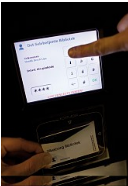
På det ubemandede Gjern Bibliotek trykker brugerne sig selv ind på biblioteket via en touch screen.