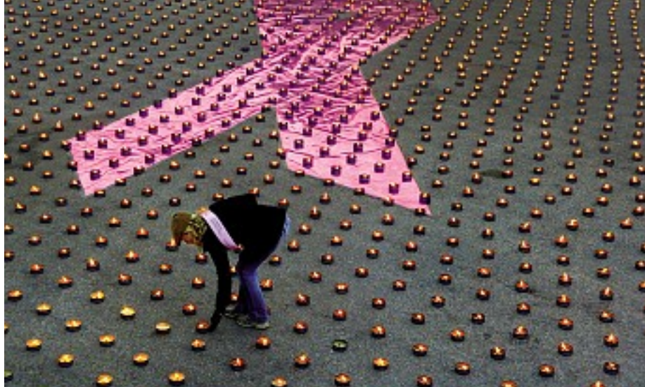
Kun få af BF's medlemmer udnytter, at de har ret til 100.000 kr., hvis de for eksempel rammes af kræft. Her 10.000 lys for kræftpatienter i Stockholm.