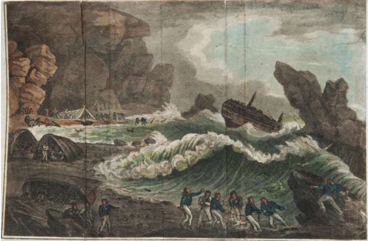
Fra bogens illustrationer: Radering fra 1805. De skibbrudne bygger lejr på Wager Island.