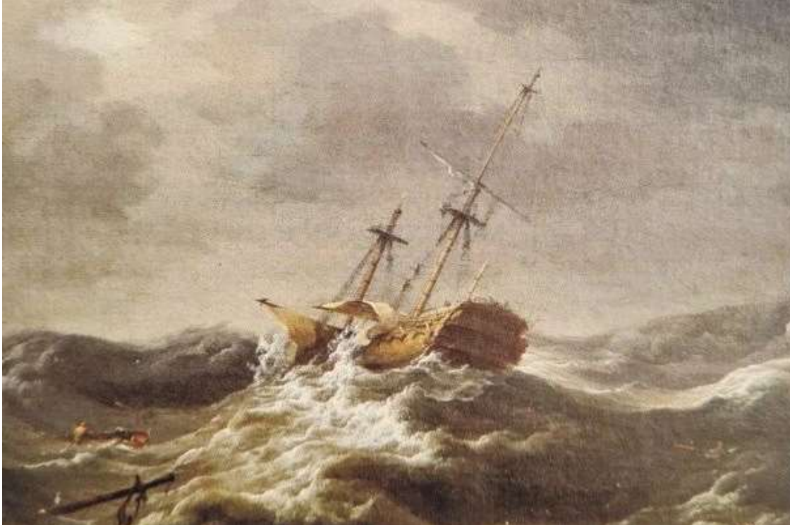
Fra bogens illustrationer: Wager efter forliset. Malet af Charles Brooking ca. 1744.