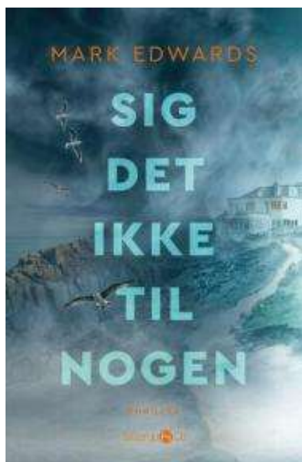
(/boeger/sig-det-ikke-til-nogen-0) SIG DET IKKE TIL NOGEN (/BOEGER/SIG-DET-IKKE-TIL-NOGEN-0) Af Mark Edwards (f. 1970)