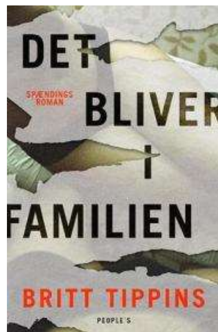
(/boeger/det-bliver-i-familien-spaendingsroman) DET BLIVER I FAMILIEN (/BOEGER/DET-BLIVER-I-FAMILIEN-SPAENDINGSROMAN) Af Britt Tippins (f. 1971)