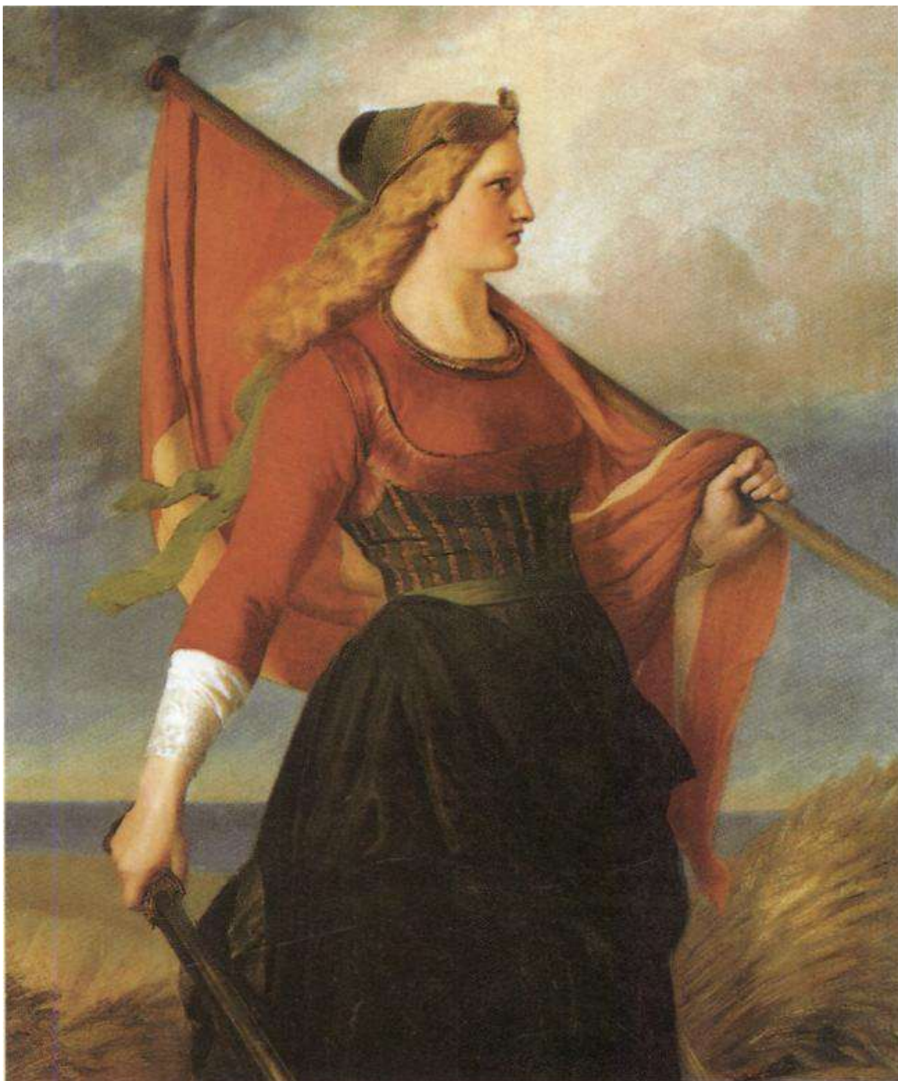
Moder Danmark, malet af Elisabeth Jerichau Baumann i 1851.

Det forhindrede dog ikke, at hun ofte solgte godt, både i Danmark og i udlandet, og at hun ikke mindst var en meget efterspurgt portrætmaler, der bl.a. malede mange medlemmer af kongefamilien, foruden mange godsejere, kulturpersonligheder m.fl. En del af hendes tidlige motivkreds med bl.a. mange sødladne og sentimentale skildringer af bondelivet gik til gengæld efterhånden af mode.