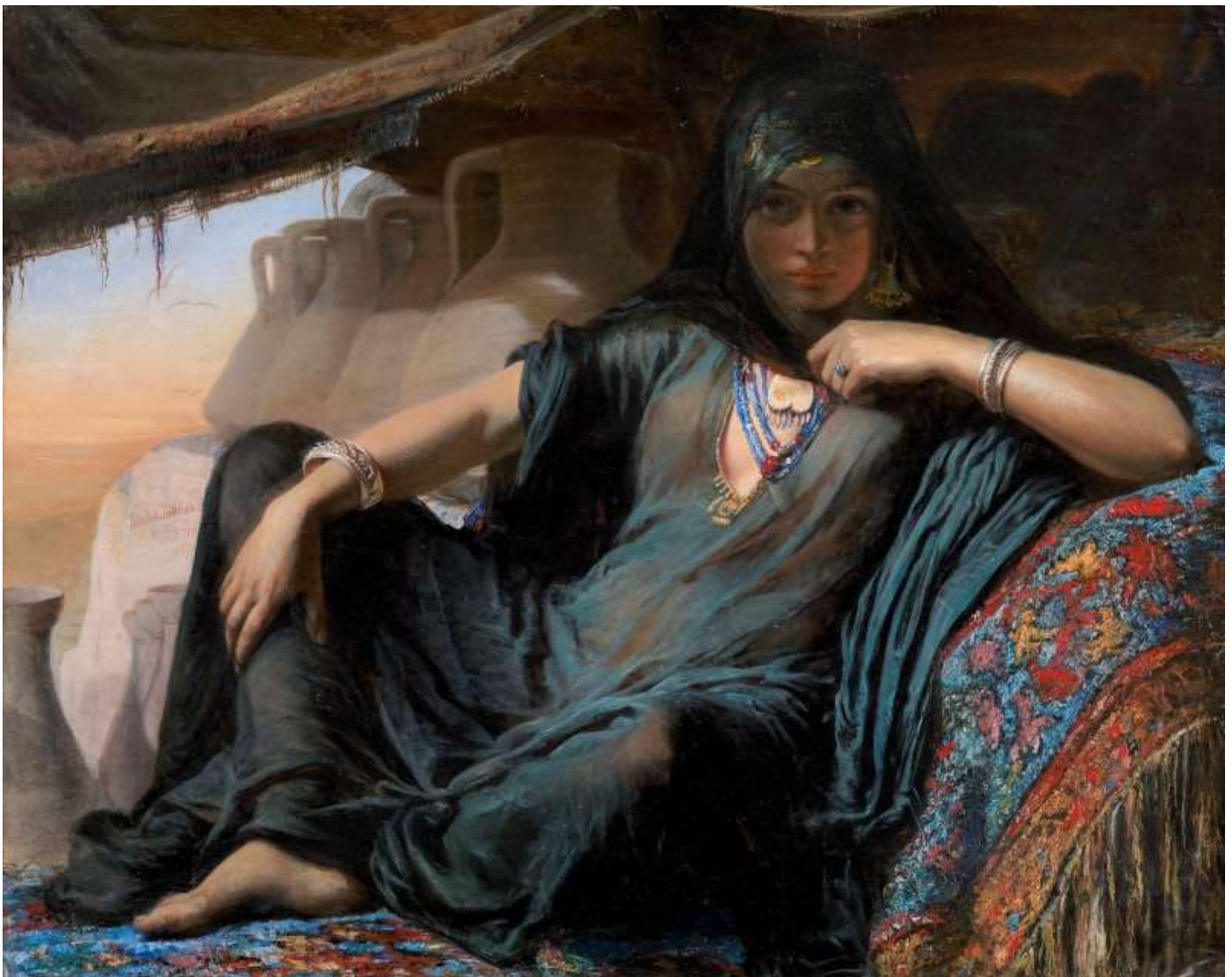
Elisabeth Jerichau Baumann: En ægyptisk pottesælgerske ved Gizeh , malet mellem 1876 og 1878.

Produktionen er ujævn, og det er langt fra det hele, som med streng nødvendighed bør kanoniseres som en vigtig del af dansk kunsthistorie. Men mange af portrætterne er gode og til dels nyskabende i en dansk sammenhæng med deres ofte lidt mere dramatiske udførelse.